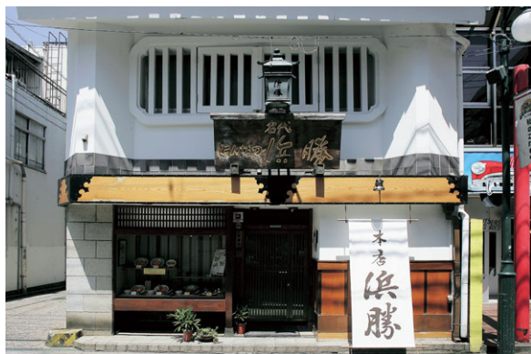
とんかつ濱かつ 本店

パートさんを含めた従業員一人ひとりのレベルアップによって「時間当たり採算」を向上させ、労働環境の構築を目指しています。われわれ経営陣がよりの確に問題点をつかみ、できるところから速やかに改善するため、「従業員満足度調査」も導入しています。「すべては人財育成」、近年社内外を見るにつけ、その思いは深くなるばかりです。