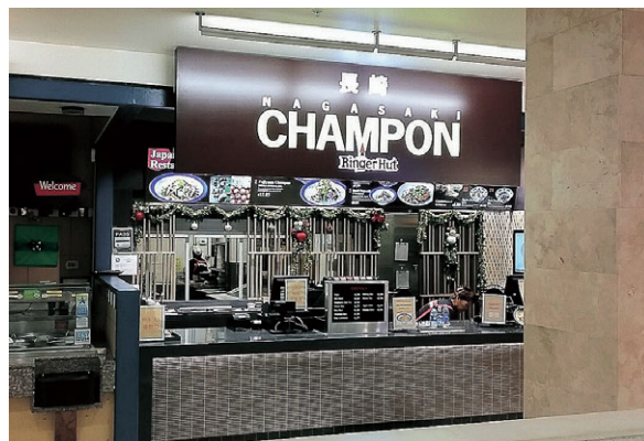
ハワイ アラモアナセンター店