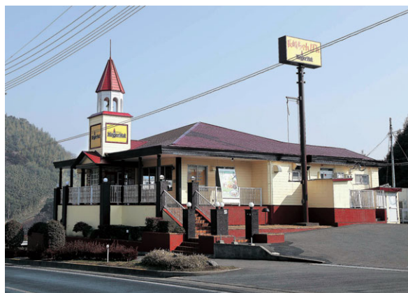
リンガーハット1号店 長崎宿町店

刻々と激変する経営環境に適応していくために私たちは企業も個人も変化を当たり前と捉え、常に「次の一手」を追求し、より魅力的な商品の開発や店舗運営にチャレンジし、来て頂くすべてのお客さまへ満足していただけるよう邁進してまいります。