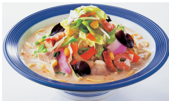
野菜たっぷりちゃんぽん

このたび、(公財)サービス産業生産性協議会が実施する2018年度「JCSI(日本版顧客満足度指数)」第1回調査で、リンガーハットが2年連続飲食部門の顧客満足度1位に選ばれました。独自に全店舗従業員参加での「サービスコンテスト」「調理コンテスト」をそれぞれ開催する事で、従業員の安定的な雇用確保やモチベーション向上を図り、それが顧客満足度の向上へも繋がっています。今後ともお客さまへご指示いただけますよう誠実に着実に企業価値向上を目指してまいります。