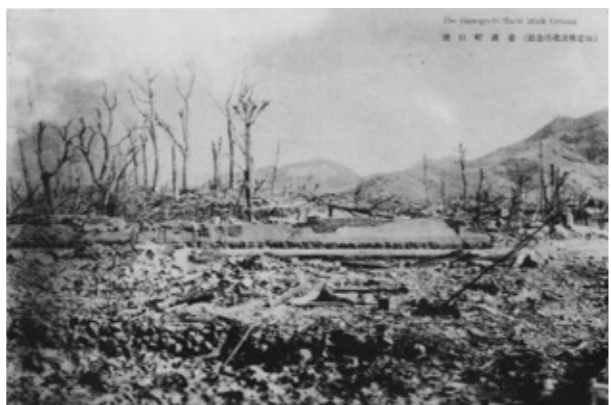
「記念塔建設予定地」と説明がある廃墟となった浜口町高台一帯

と同様な答えに終始してきたが、上記の『長崎新聞』の記事により原爆の災禍から一年余り後の、昭和二十一年に長崎市が発行したことが判明したので一挙に疑問が解消した。